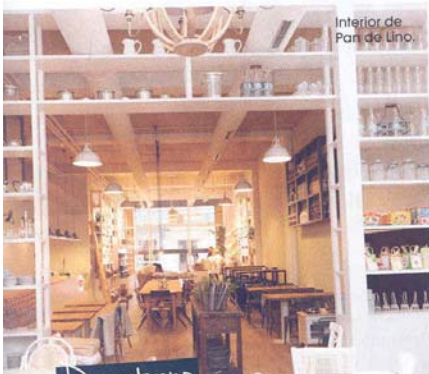
Interior de Pan de Lino.

Estas charcuterías deluxe (con locales en Barcelona y Madrid) se han aliado a Carrasco-Guijuelo para crear un moderno pack take away con contenido muy clásico. Aceite de oliva, tomate, pan y jamón listos para preparar en casa o en la oficina, uno de los básicos de cualquier desayuno mediterráneo. Para completar la lista de embutidos, la firma cuenta con fuetts, butifarras o salchichones convertidos en las delicatessen más exquisitas. www.masgourmets.com