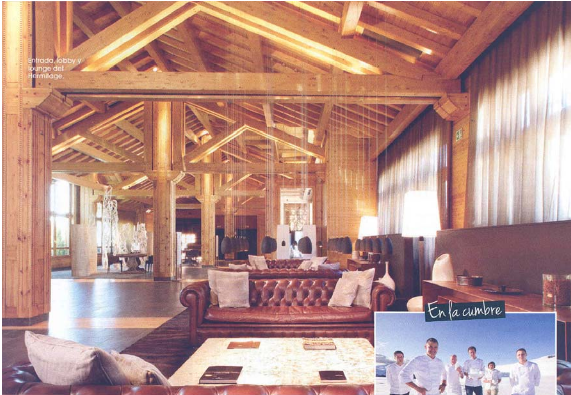
En la cumbre