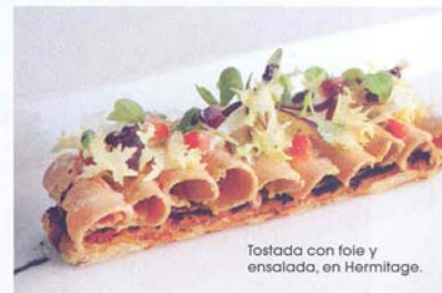
Tostada con foie y ensalada, en Hermitage.