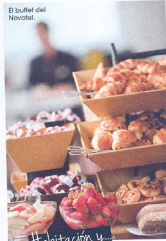
El buffet del Novotel.

Cereales ecológicos, zumos naturales, ensaladas y verduras, hamburguesas orgánicas, cupcakes, brownies y sándwiches en la coruñesa calle Rosalía de Castro. Cuenta con tienda de productos gourmet, menaje, regalos y take away. Tiene terraza cubierta, Wi-Fi, zona de juegos y brunch dominical. Un must. www.pandelino.es