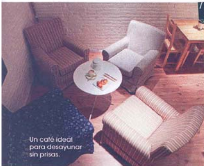
Un café ideal para desayunar sin prisas.